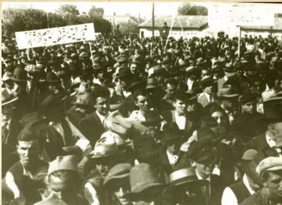
Народне демонстрације у Пожаревцу уочи Другог светског рата, 1941. People's demonstrations in Požarevac shortly before the beginning of World War II, 1941